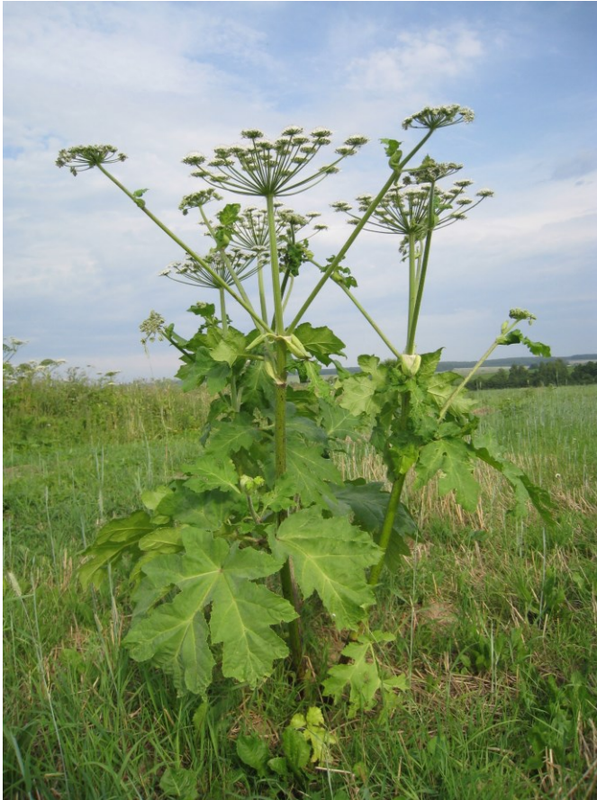
Barszcz Sosnowskiego ( Heracleum sosnowskyi )

Rodzina baldaszkowatych, do której należy barszcz Sosnowskiego liczy około 3000 gatunków bylin, roślin dwuletnich i jednorocznych o charakterystycznym wyglądzie i jednolitej budowie kwiatów i owoców. Większość baldaszkowatych żyjących w Polsce należy do chwastów łąkowych i pastwiskowych, duszących lub ogłodzających rośliny pastewne.