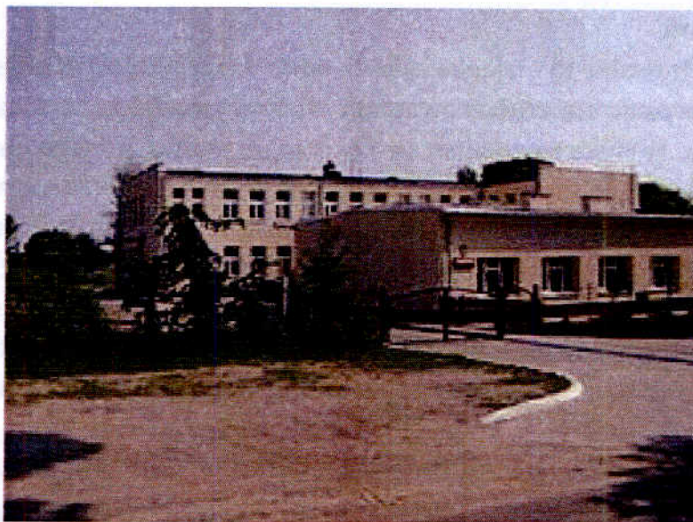
Szkoła Podstwiowa w Mielenku Drawskim

Uczniowie w wieku gimnazjalnym uczęszczają do Gimnazjum im. Adama Mickiewicza w Drawsku Pomorskim, do którego dojeżdżają bezpłatnie autobusami PKS. Natomiast w wieku późniejszym wybierają szkoły średnie i zawodowe głównie w Drawsku Pomorskim, sporadycznie w Kaliszu Pomorskim. We wsi niewiele osób studiuje. Przeważnie jest to tryb niestacjonarny. Ośrodkami, w których kształcą się mieszkańcy są Szczecin, Koszalin oraz Poznań.