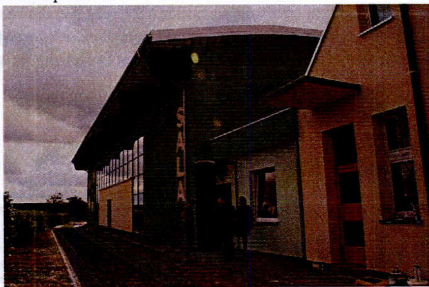
Sala sportowa w Mielenku Drawskim

Funkcje rekreacyjne dla mieszkańców Mielenko Drawskiego spełniają piękne okoliczne lasy oraz zbiorniki wodne oddalone o ok. 1,5-2 km. Korzystanie z nich jest jednak utrudnione, ze względu, iż leżą one na terenie poligonu drawskiego. Przez miejscowość przebiega także rowerowy pomarańczowy szlak turystyczny, a w pobliżu szlak kajakowy im. Ks. Kardynała Karola Wojtyły. W miejscowości znajduje się także boisko sportowe oraz hala sportowa.