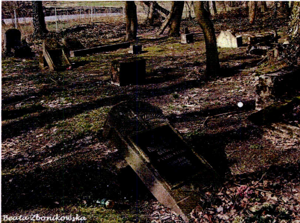
Cmentarz ewangelicki w Mielenku Drawskim