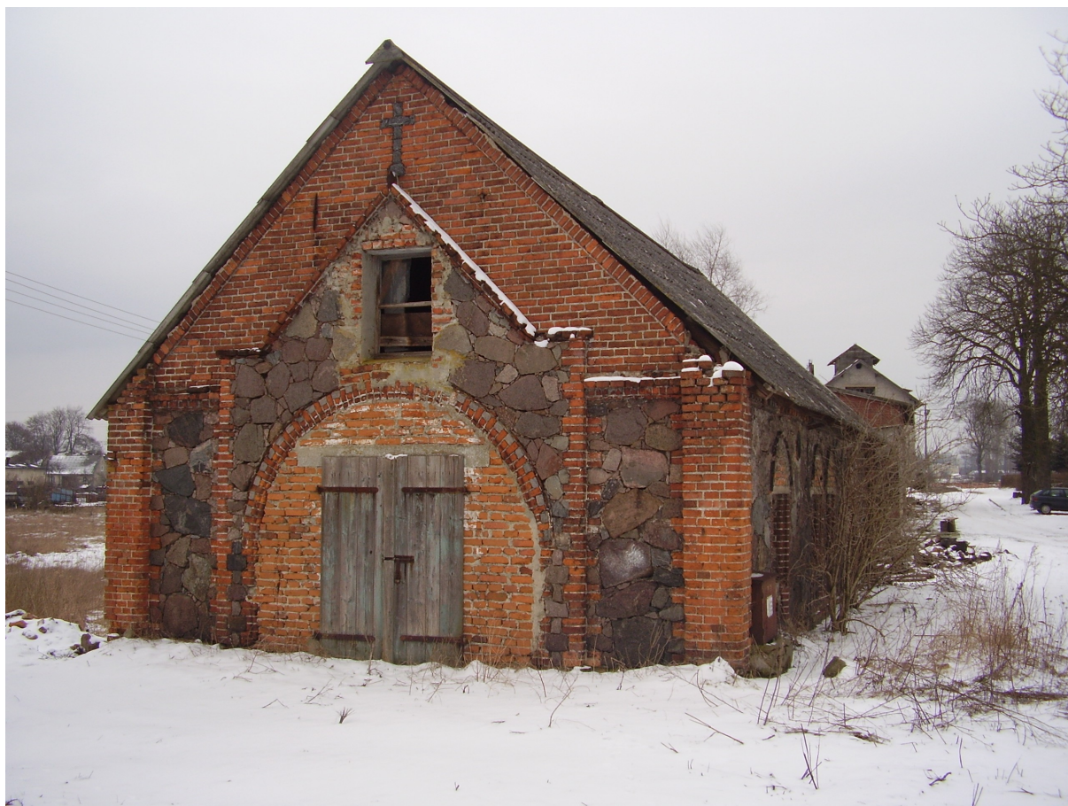
Dworskie zabudowania gospodarcze - kuźnia