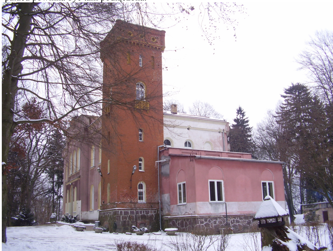
Pałac z XIX w.