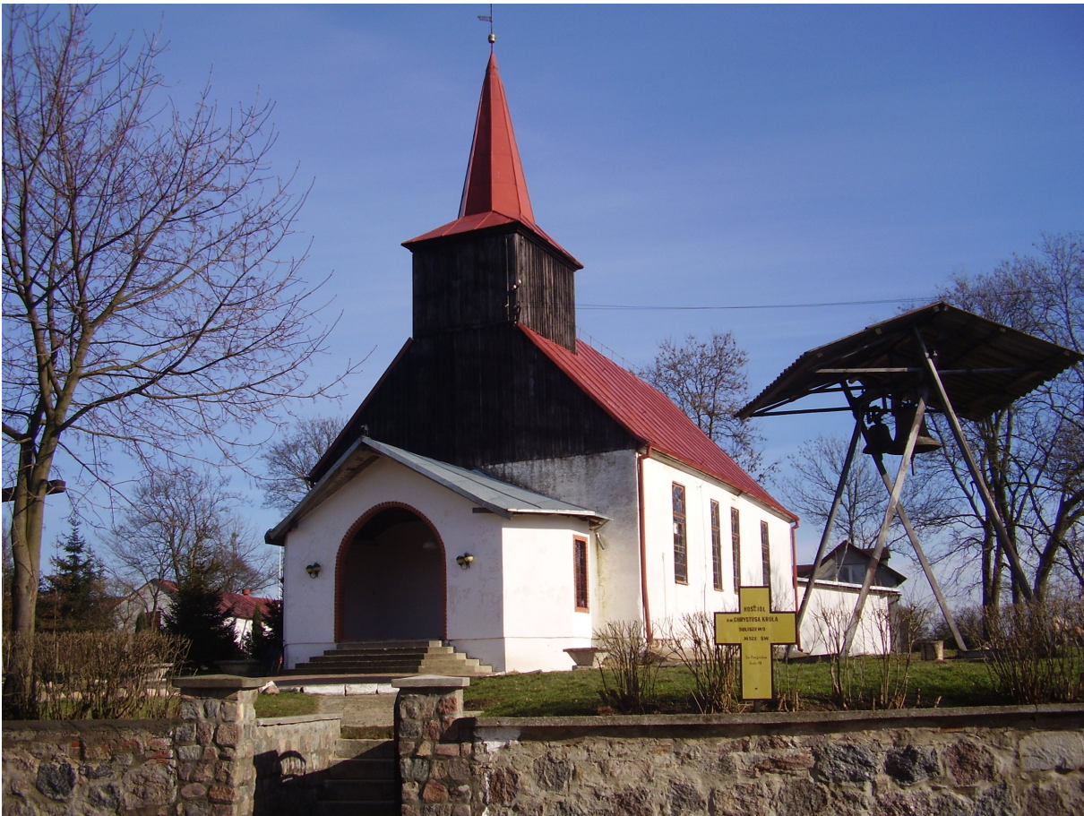
Kościół Chrystusa Króla z XVII w.