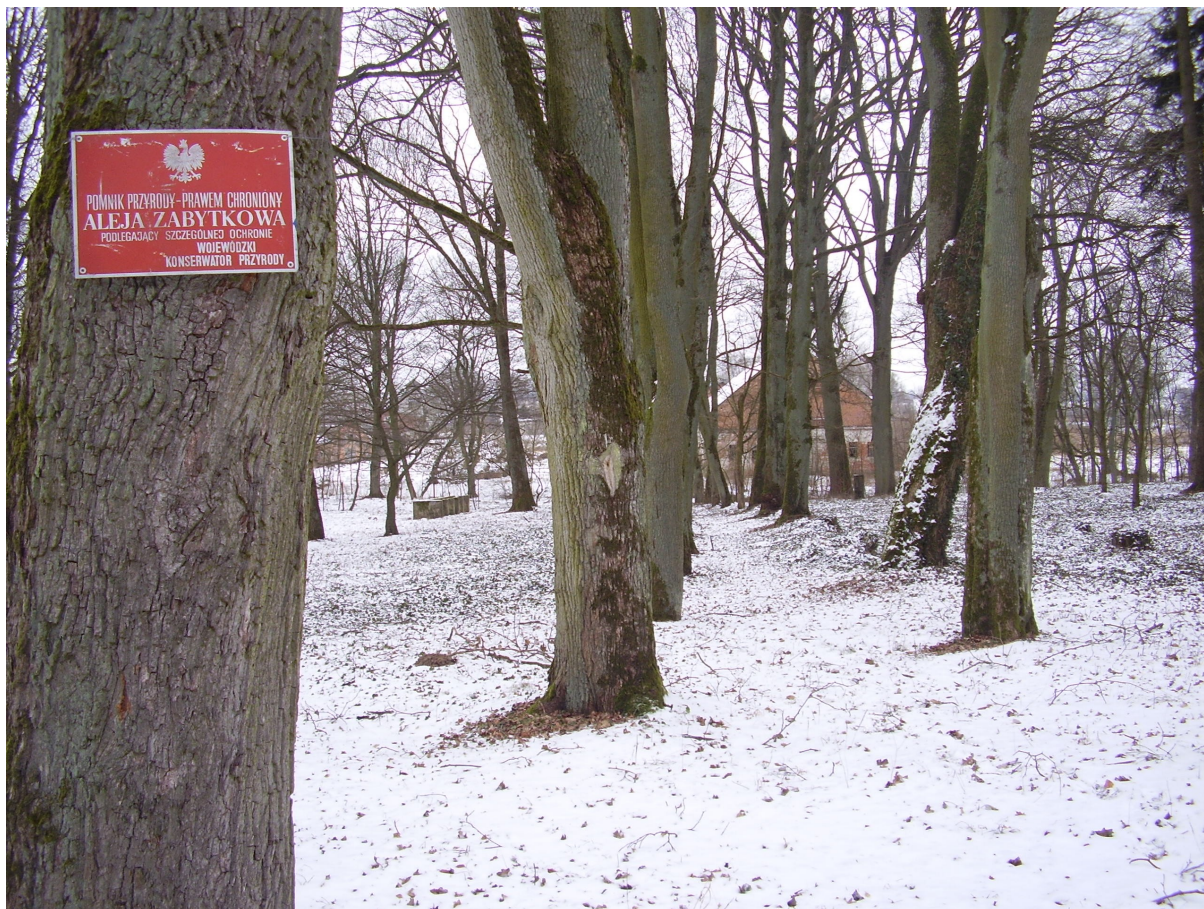
Aleja zabytkowa w parku przypałacowym