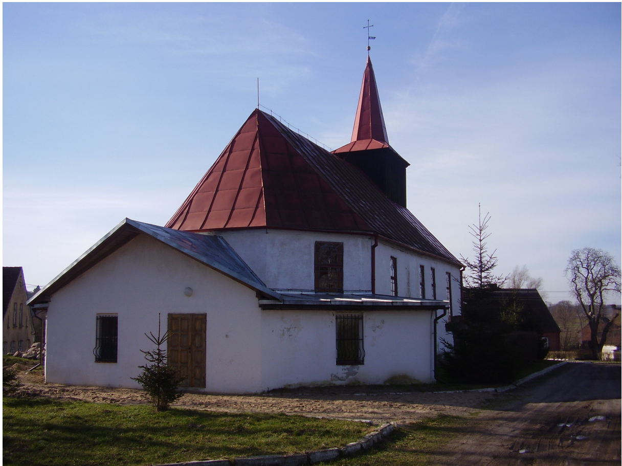
Kościół Chrystusa Króla z XVII w.