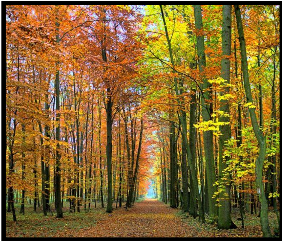
Mielno, luty 2009 r.

gmina: Dębica Kaszubska, powiat słupski województwo pomorskie