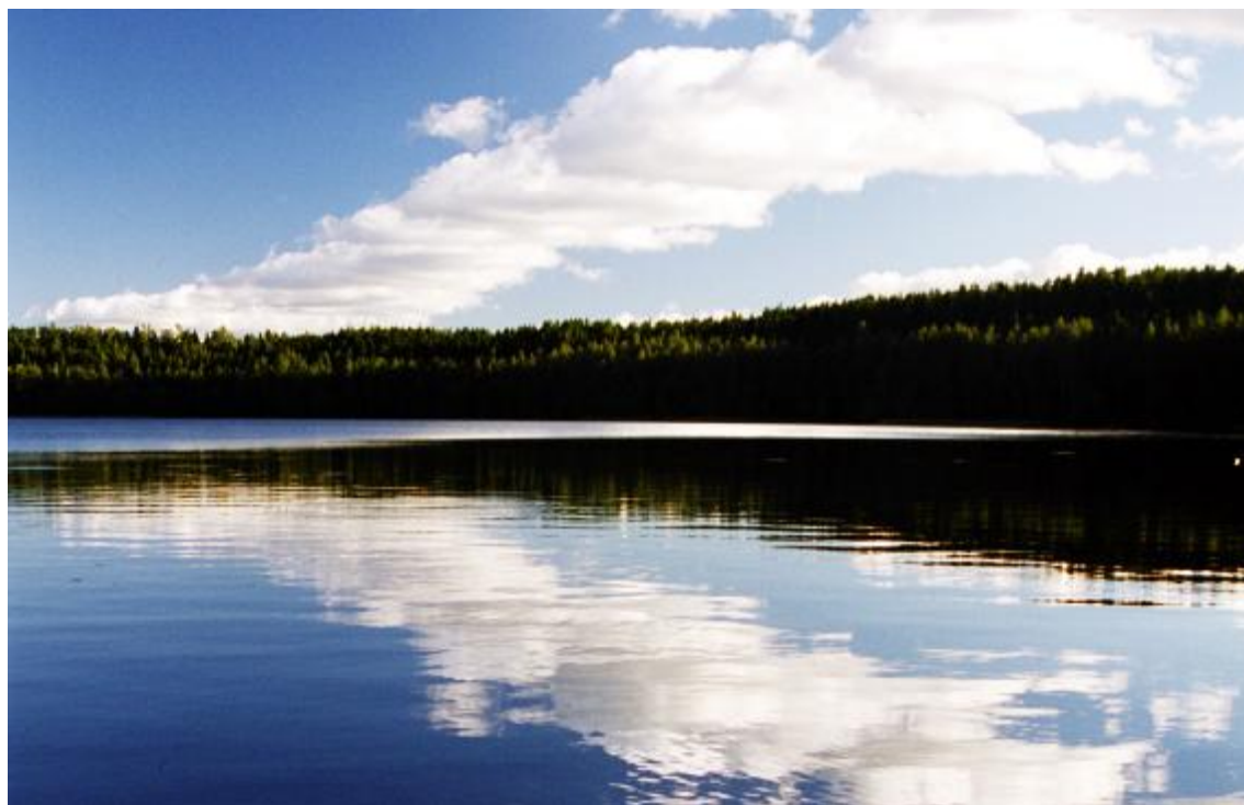
Gałęzów luty 2009 r.