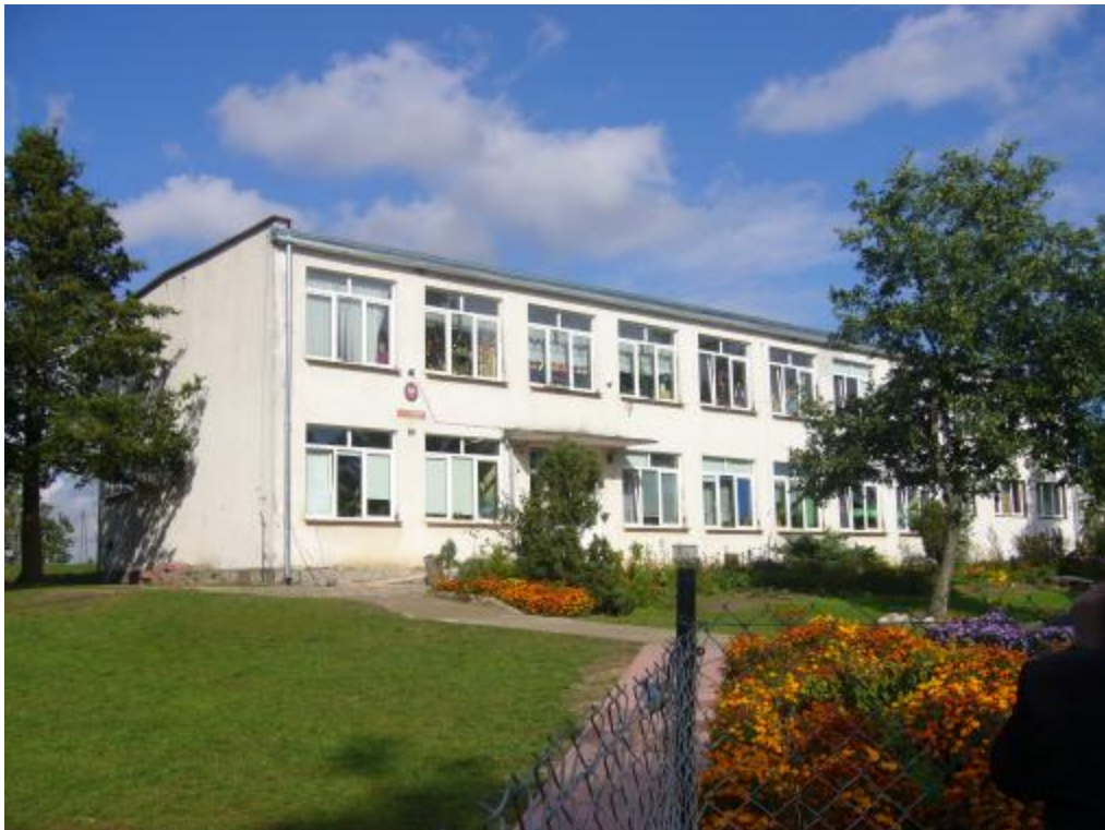
Gogolewo luty 2009 r.

gmina: Dębica Kaszubska, powiat słupski województwo pomorskie